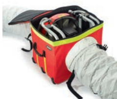
V-Box im Belüftungsmodus