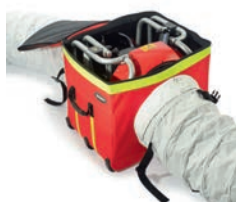
V-Box im Entlüftungsmodus