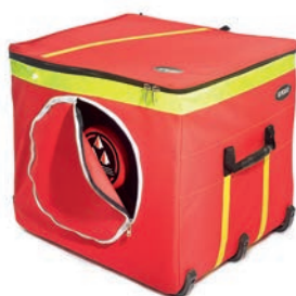
Kubus V-Box ohne Lutte